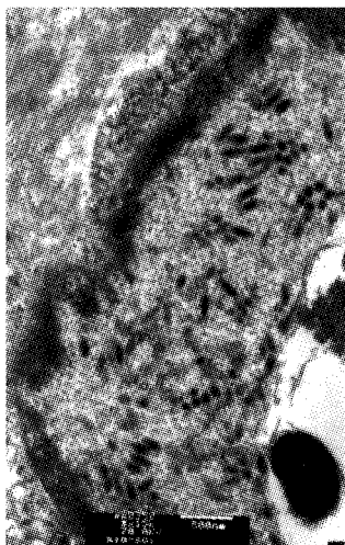
图 1 鳃组织中杆状病毒

在电子显微镜下看到血淋巴、鳃组织细胞核中有大量杆状病毒颗粒,血淋巴中最多,大小为 (225.6~280.5) nm × (73.2~176.8) nm (图 1)。