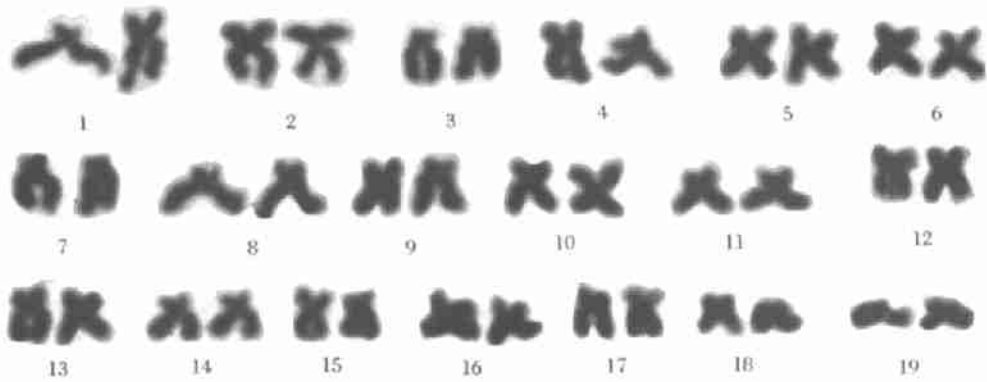
图 2 魁蚶的核型(330×8.5)