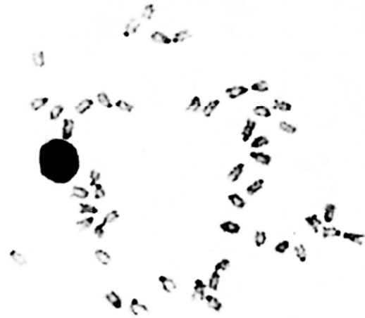
图 3 布氏石斑鱼中期分裂相 C-带 Fig. 3 Metaphase chromosomes of E. bleekeri with C-banding

目前, 包括布氏石斑鱼在内, 已研究过染色体基本核型的 24 种石斑鱼的染色体臂数变动范围为 48~62 [9-28] , 其中有 13 种保持了鲈形目的原始核型(2n=48t)臂数 48, 其它 11 种石斑鱼的染色体臂数的增加主要是因为这些石斑鱼的染色体组中出现了较多的中部着丝粒和亚中部着丝粒染色体, 如鲑点